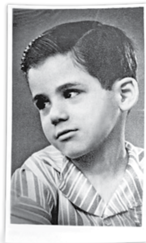
“A vida é muito curta para ser pequena”